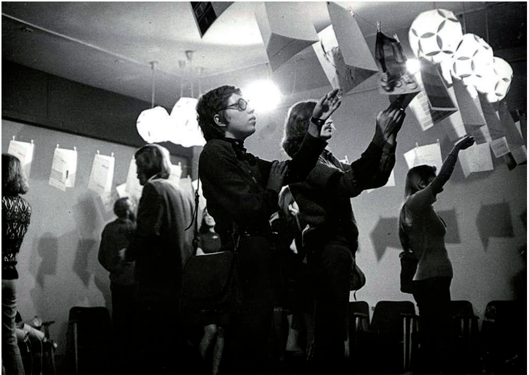
3. Overzichtsfoto van de tentoonstelling van Art & Project Bulletins in Klub ZPAP, Poznan. 3. Survey photograph of the exhibition of Art & Project Bulletins in Klub ZPAP, Poznan.